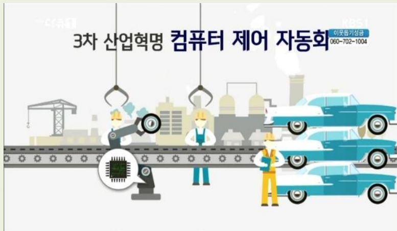
3차 산업혁명 (컴퓨터 활용 정보화)