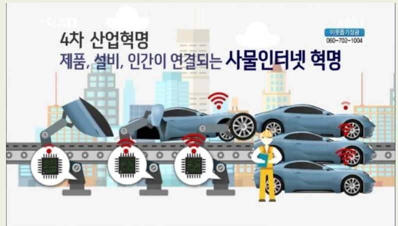
4차 산업혁명 (로봇, 인공지능, 나노, 사물인터넷 등)