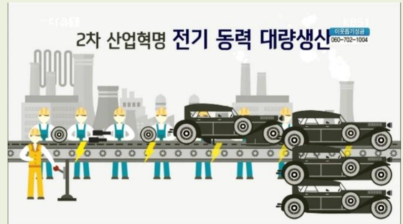
2차 산업혁명 (전기 이용 대량생산)