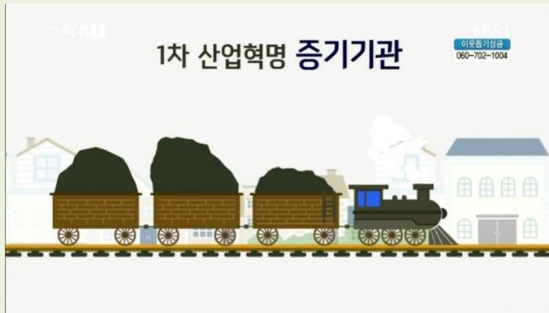
1차 산업혁명 (증기기관)