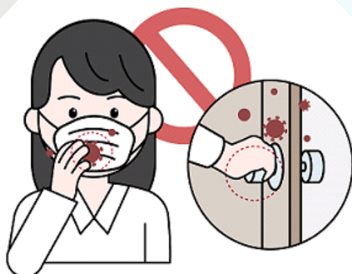
③ 마스크 걸면을 만지는 행위