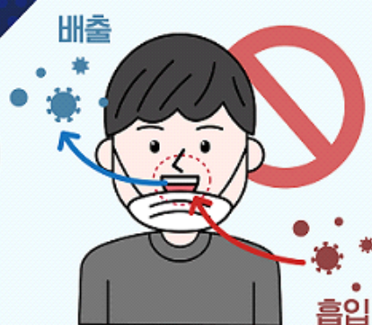
② 턱에 걸치는 마스크 착용