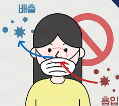
① 코가 노출되는 마스크 착용