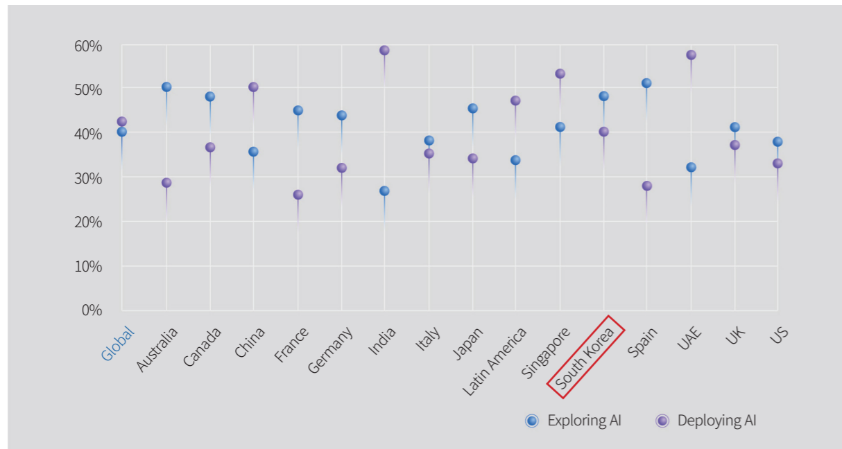
[그림 1] 국가별 AI 도입기업 비중 현황